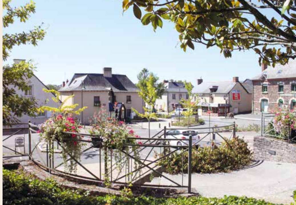
Square du contour de l'Église