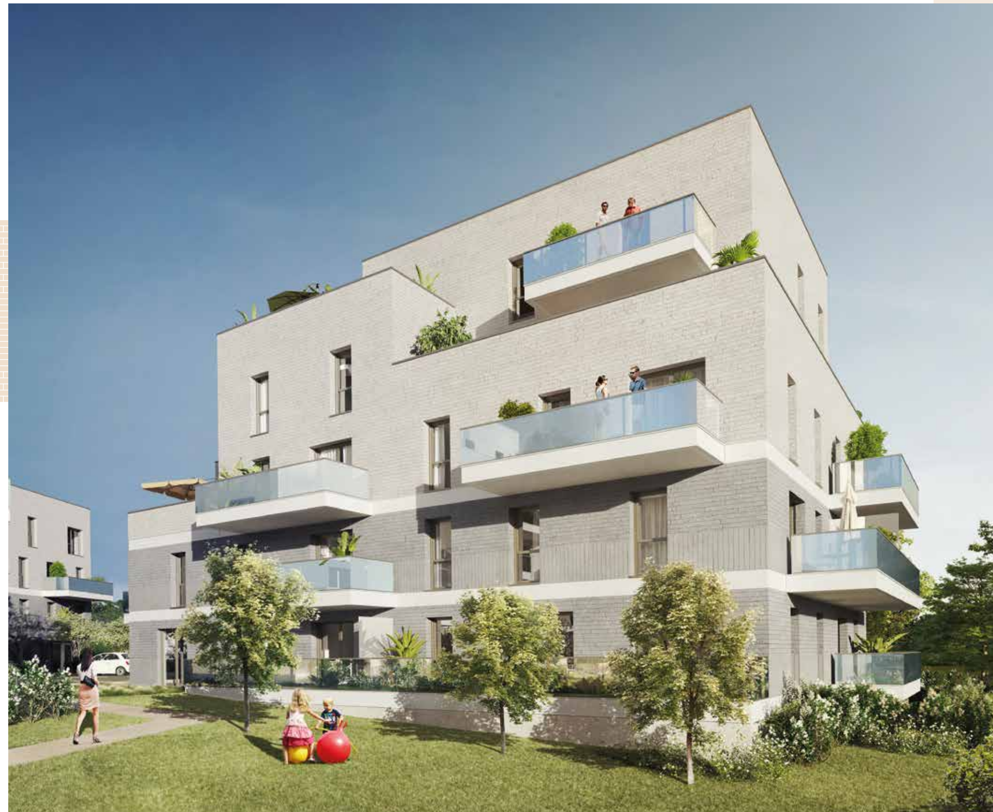
Vue côté jardin intérieur