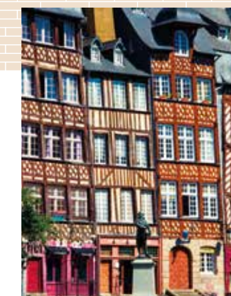
Place du Champ Jacquet

Pour rejoindre Rennes à vélo, en bus ou en voiture, Vezin-le-Coquet dispose d'un accès direct : l'université de Rennes II, le Roazhon Park sont ainsi facilement accessibles.