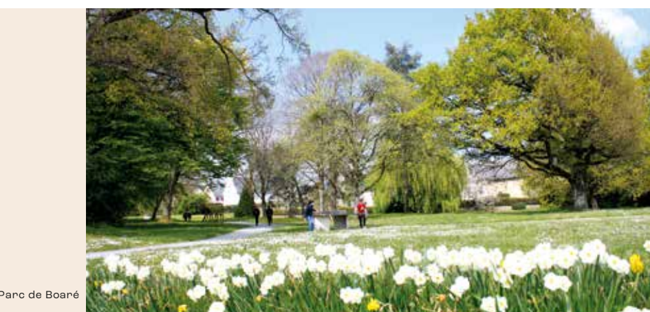
Parc de Boaré

Une intense vie culturelle et économique anime Rennes toute l'année.