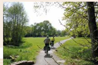
Parc de Boaré

D'ailleurs, les cheminements piétons et cycles irriguent la commune et vous mèneront dans les parcs et en pleine campagne.