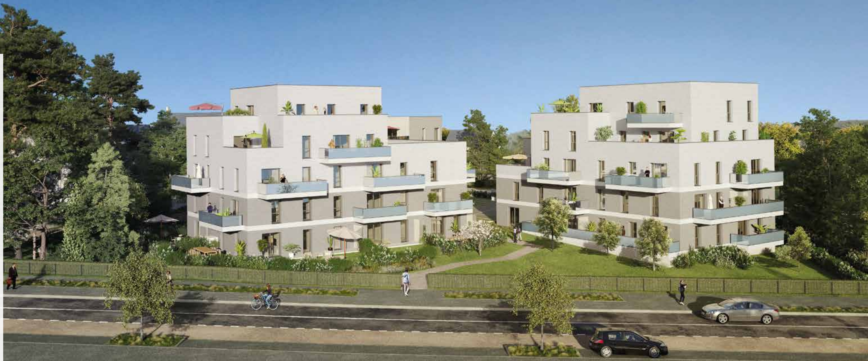
Vue depuis l'Avenue des Champs Bleus

La texture et les teintes des briquettes minérales recouvrant les façades créent un discret relief et offrent le gage d'une intégration réussie.